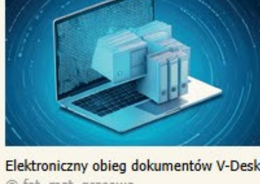
Elektroniczny obieg dokumentów V-Desk